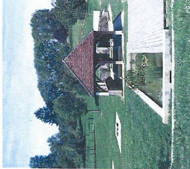
Inscrite à l'inventaire des Monuments Histo